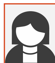
Adelaïde DA COSTA (TAM)